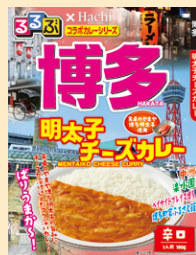
⑥博多明太子チーズカレー辛口