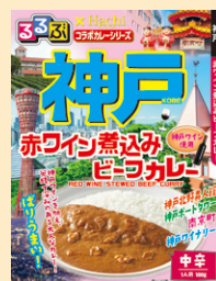
⑩神戸赤ワイン煮込みビーフカレー中辛