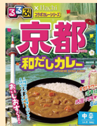
⑩京都和風だしカレー中辛