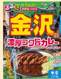
①金沢濃厚コク旨カレー中辛