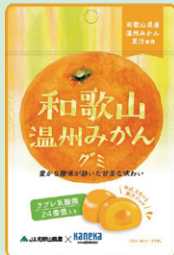
①和歌山温州みかん