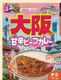
⑥大阪甘辛ビーフカレー中辛