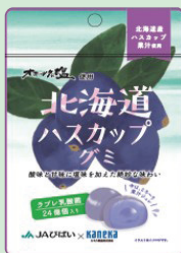
④北海道ハスカップ