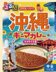
⑩沖縄キーマカレー(タコライス風)中辛