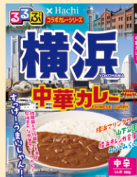
①横浜中華カレー中辛