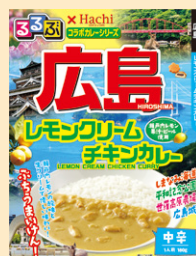
⑩広島レモンクリームチキンカレー中辛