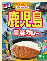
⑩鹿児島黒豚カレー中辛