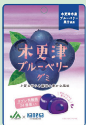
⑨木更津ブルーベリー