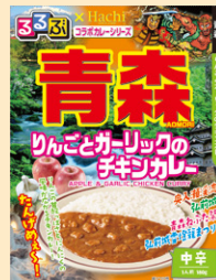
⑩青森りんご&ガリックのチキンカレー中辛