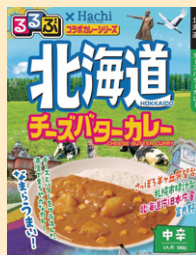
④北海道チーズバターカレー中辛